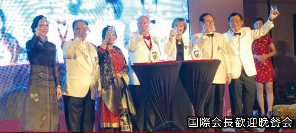
国際会長歓迎晩餐会